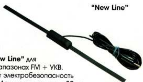
Антенна "New Line" для приема в диапазонах FM + УКВ. Не нарушает электробезопасность автомобиля. Дальность приема - 50км.