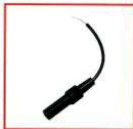
Хвостик для подключения автомагнитов