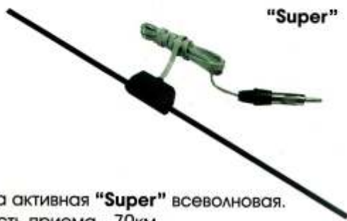
Антенна активная "Super" всеволновая. Дальность приема - 70км.