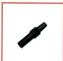
Гнездо для автомагнитол