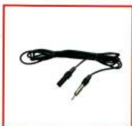
Удлинитель автомобильный 2м, 3м, 4м